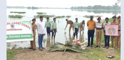
మహేశ్వరం చెరువును పరిశీలిస్తున్న విద్యార్థులు