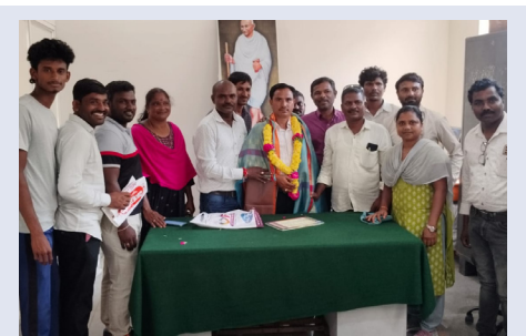
జైవల్ నాయక్ ను సన్మానిస్తున్న అసోసియేషన్ నాయకులు

తూకంలో మోసాలు కిరాణి వస్తువులను సైతం షాపింగ్ మాల్స్ లో అధిక రేట్లకు విక్రయిస్తున్నారని ఒక ఆయిల్ ప్యాకెట్ బయట షాపుల కన్నా ₹5 నుండి 7 రూపాయల వరకు అధికంగా అమ్ముతున్నట్లు సమాచారం. పప్పులు, నిత్యావసర వస్తువులను కూడా ప్యాకింగ్ చేసి అధిక ధరకు అమ్ముడేమే కాకుండా తూకంలో కూడా మోసాలు కనపడుతున్నాయని ప్రజలు చర్చించుకుంటున్నారు. ఆఫర్ పేరుతో ప్రజల్ని ఆకర్షించి అధిక వస్తువులను కస్టమర్లతో కొనిపించడమే లక్ష్యంగా వ్యవహరిస్తున్నట్లు పట్టణ ప్రజలు చర్చించుకుంటున్నారు.