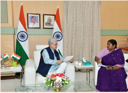
గవర్నర్ తో మాట్లాడుతున్న మంత్రి సీతక్క