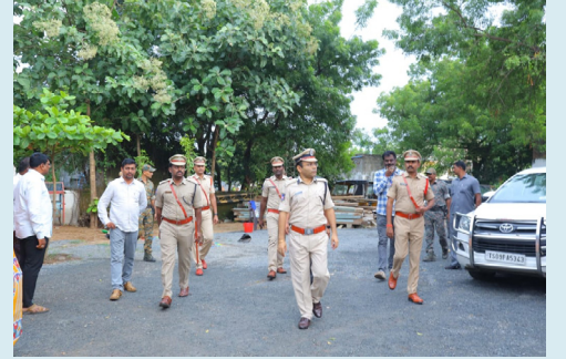
పోలీస్ స్టేషన్ పరిసరాలను పరిశీలిస్తున్న సీసీ

అటవీశాఖ డిస్సిపల్ చీఫ్ కన్స్ట్రక్టర్ ఆఫ్ ఫారెస్ట్ (పీసీసీఎఫ్)కు సిఫారసు చేశారు.