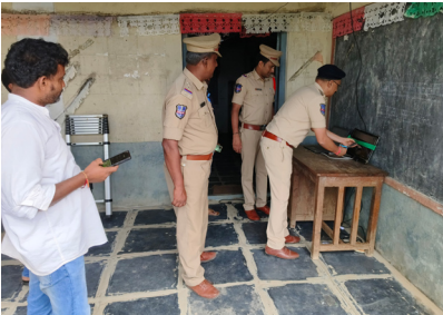
సీసీ కెమెరాలను ప్రారంభిస్తున్న డిఎస్పీ