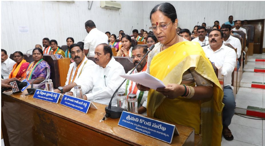
కౌన్సిల్ సమావేశంలో మాట్లాడుతున్న మంత్రి కొండా సురేఖ