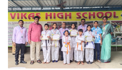
పథకాలు సాధించిన విద్యార్థులతో ఉపాధ్యాయులు