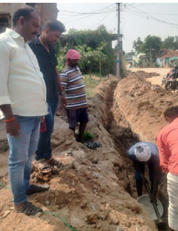
పనులను పరిశీలిస్తున్న అధికారి