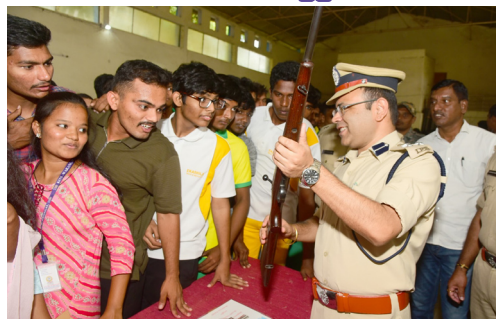
యువతకు తుపాకీ పని తీరును వివరిస్తున్న సీపీ