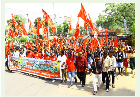
ర్యాలీలో పాల్గొన్న పీడిఎస్ యూ నాయకులు

ఈ మండలంలోని కొన్ని గ్రామాలు రేషన్ బియ్యం అక్రమ వ్యాపారానికి అడ్డాగా మారినట్లు స్పష్టంగా కనబడుతుంది. గత రెండు మూడు నెలల నుంచి ఈ మండలంలోని చర్లపల్లి, పులిగిల్ల, నర్సకపల్లి తదితర గ్రామాల్లో టాన్స్ ఫోర్స్ అధికారులు దాడులు జరిపి పీడిఎస్ రైస్ నిలువలను పట్టుకోవడం ఇందుకు నిదర్శనం. నడికూడ మండలం నుంచి భూపాలపల్లి మీదుగా మహారాష్ట్రకు పీడిఎస్ బియ్యం తరలి వెళుతున్నాయని స్థానికులు చెబుతున్నారు. ఇంత జరుగుతున్నా పీడిఎస్ బియ్యం అక్రమ వ్యాపారాన్ని కంట్రోల్ చేయాల్సిన రెవిన్యూ అధికారులు నిమ్మకు నీరెత్తునట్లుగా వ్యవహరిస్తుండటం తీవ్ర విమర్శలకు తావిస్తోంది. చర్యలు లేకపోవడం వల్ల రేషన్ బియ్యం అక్రమార్కులకు రెవెన్యూ శాఖలోని కొందరు అధికారుల సహకారం ఉందా? అనేది ఇక్కడ చర్చనీయాంశమైంది.