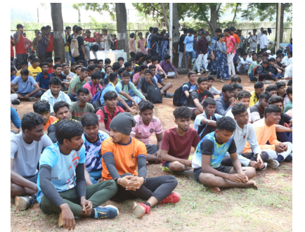
పోటీలకు హాజరైన క్రీడాకారులు