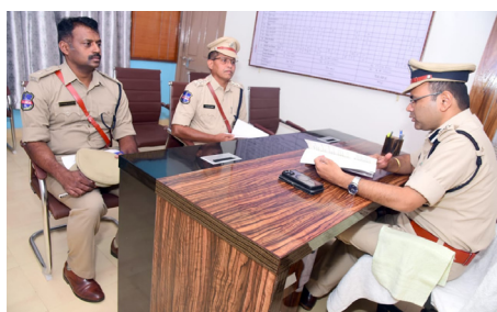
రికార్డులను పరిశీలిస్తున్న సీపీ అంబర్ కిషోర్ రూ

అక్షర దర్బార్, పరకాల : శాంతి భద్రతల విషయంలో పోలీసు అధికారులు నిర్లక్ష్యంగా వ్యవహరిస్తే సహించేది లేదని పరంగల్ పోలీస్ కమిషనర్ అధికారులను హెచ్చరించారు. వారిక తనిఖీలో భాగంగా పరకాల ఎసీపి కార్యాలయాన్ని పరంగల్ పోలీస్ కమిషనర్ మంగళవారం తనిఖీ చేసారు. రికార్డులను పరిశీలించడంతో పాటు, ఎసీపీ అధ్యక్షులతో దర్బారు జరిగిన కేసుల ప్రస్తుత స్థితిగతులపై కమిషనర్ ఆరా తీశారు. ప్రతి పోలీస్ స్టేషన్లో పాటు, బ్యాంకులు, ఇతర ప్రధాన కూడళ్ళలో సీసీ కెమెరాలు ఏర్పాటుకు అధికారులు చొరవ చూపించాలని అన్నారు.