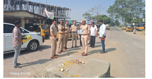
పోలీస్ అధికారులతో మాట్లాడుతున్న డీఎస్సీ