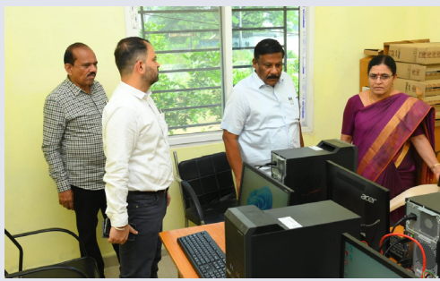
కార్యాలయాన్ని పరిశీలిస్తున్న కలెక్టర్

బట్టికొట్టులో ఉన్న 3 గుంటలు తక్కువ రెండు ఎకరాల ప్రభుత్వ భూమి కబ్బాకు గురయ్యింది వాస్తవమే. దీనిపై అడిషనల్ కలెక్టర్ నుంచి మెమో సైతం మాకు వచ్చింది. చిన్న కాళేశ్వరం ప్రాజెక్ట్ పనుల్లో అధికారులమంతా నిమగ్నమై ఉండడంతో కబ్బా భూమిని స్వాధీనం చేసుకోవడంలో అలస్యమైంది. త్వరలోనే ప్రభుత్వ భూమిని స్వాధీనం చేసుకుంటాం.