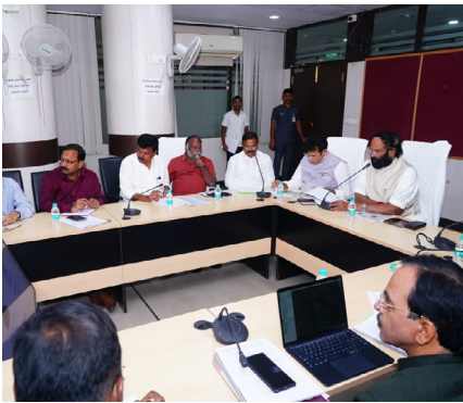
సమావేశంలో పాల్గొన్న మంత్రులు ఉత్తమ, శ్రీధర్ బాబు

పౌరసరఫరాల మంత్రి ఉత్తమ కుమార్ రెడ్డి, ఐటీ, పరిశ్రమల మంత్రి, మంధని ఎమ్మెల్యే దుద్దిళ్ల శ్రీధర్ బాబు భేటీ అయ్యారు. ఈ సందర్భంగా ఉన్నతాధికారులతో సమీక్ష సమావేశం నిర్వహించి పలు అంశాలపై చర్చించుకున్నారు. అనంతరం చిన్న కాళేశ్వరం (ముక్తేశ్వర) ఎత్తిపోతల పథకం పనులకు రూ.571.57 కోట్ల పరిపాలన అనుమతి లభించినట్లు సమీక్ష అనంతరం మంత్రి శ్రీధర్ బాబు అధికారికంగా వెల్లడించారు. మొత్తం 45 వేల ఎకరాలకు సాగునీరు, అర టీఎంసీ నీటిని మంచి