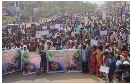
రహదారిపై నిరసన తెలుపుతున్న ఆదివాసీ ప్రజలు

అక్షరదర్బార్, ములుగు: మావోయిస్టుల దుశ్చర్యను నిరసనగా ములుగు జిల్లా ఏటూరునాగారం మండలకేంద్రంలో ఆదివాసీ సంఘాల నాయకులు, ఆదివాసీలు పెద్ద ఎత్తున నిరసన ర్యాలీ చేపట్టారు. అనంతరం ధర్నా.. రాస్తారోకో నిర్వహించారు. వై జంక్షన్ నుంచి బస్టాండ్ వరకు చేపట్టిన ర్యాలీలో మావోయిస్టులు డౌన్ డౌన్ అంటూ పెద్దపెట్టున నినాదాలు చేశారు. అమాయక ఆదివాసీలను చంపడమే మావోయిస్టు సిద్ధాంతమా అంటూ బ్యానర్లు, ప్లకార్డులు ప్రదర్శించారు. వాణిడు మండలం పెనుగోలు గ్రామానికి చెందిన ఇద్దరు ఆదివాసీలను ఇన్ ఫార్మర్ నెపంతో మావోయిస్టులు హత్య చేయడం దారుణమని మండిపడ్డారు.