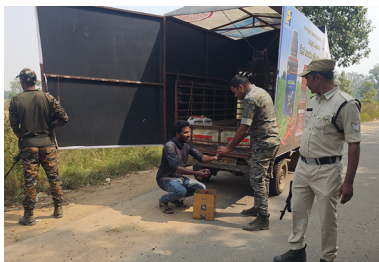
తనిఖి చేస్తున్న పోలీసులు

అక్షర దర్బార్, మహాదేవపూర్ : వాజేడు సంఘటనతో అప్రమత్తమైన పోలీసు యంత్రాంగం అటవీ ప్రాంత మండలమైన పలిమేల మండలంలో విస్తృత తనిఖీలు నిర్వహిస్తున్నారు. గోదావరి తీర ప్రాంతమైన వాజేడులో పోలీసులు ఇన్సార్చర్ల నేపథ్యంలో మావోయిస్టులు దుశ్చర్యకు పాల్పడిన సంఘటన విధితమే కాగా గోదావరి తీరం ప్రాంతమైన పలిమేల మండలం దానికి తోడు అటవీ ప్రాంతం మావోయిస్టు ప్రాబల్య ప్రాంతం కావడంతో మావోయిస్టులు ఈ ప్రాంతంలో సంచరించే అవకాశం ఉందని ముందు జాగ్రత్త చర్యగా పోలీసులు రోడ్ల వెంబడి ఉన్న కల్పరిట్లను,