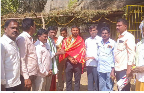
డీఎఫ్ఓను సన్మానిస్తున్న జాతర కమిటీ సభ్యులు