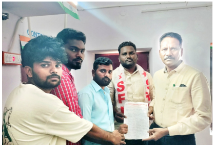
ఎక్సైజ్ సీఐకి వినతి పత్రం ఇస్తున్న నాయకులు