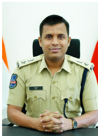
సామాజిక మాధ్యమాల్లో వ్యక్తిగత విషయాలు అవెలోడ్ చేయవద్దనీ అన్నారు. సైబర్ నేరాల బారిన పడకుండా ఉండాలంటే అప్రమత్తతే