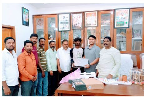
విద్యార్థికి ల్యాప్ టాప్ అందజేస్తున్న అవియుక్ట్ రెడ్డి

అక్షర దర్బార్, న్యూఢిల్లీ : పార్లమెంట్ బడ్జెట్ సమావేశాల తేదీలు ఖరారుయ్యాయి. జనవరి 31 నుంచి ఫిబ్రవరి 13 వరకు పార్లమెంట్ బడ్జెట్ సెషన్స్ జరగనున్నాయి. ఫిబ్రవరి 1న 2025-26 ఆర్థిక సంవత్సరం బడ్జెట్ను పార్లమెంట్లో కేంద్ర ప్రవేశ పెట్టబోతున్నది. మార్చి 10 నుంచి ఏప్రిల్ 4 వరకు రెండో విడత సమావేశాలు జరగనున్నాయి. ఈనెల 31న పార్లమెంట్లో రాష్ట్రపతి డ్రాపిడి ముర్ము ప్రసంగించనున్నారు. ఢిల్లీ ఎన్నికల కారణంగా ఫిబ్రవరి 5న, రవిదాస్ జయంతి నేపథ్యంలో ఫిబ్రవరి 12న సెలవు ఉండనున్నది. ఈ మేరకు ఇవాళ సాయంత్రం కేంద్రం అధికారిక ప్రకటన విడుదలచేసింది.