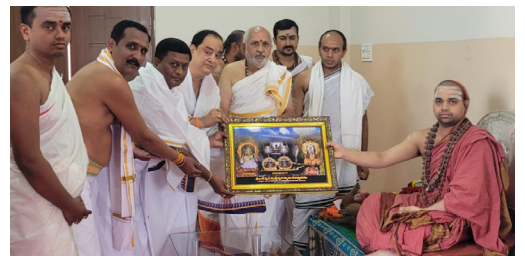
మఠాధిపతికి చిత్రపటాన్ని అందిస్తున్న ఆలయ అధికారులు