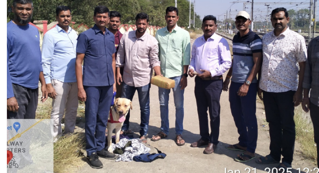
గంజాయిని పట్టుకున్న జాగిలంతో యాంటీ డ్రగ్స్ కంట్రోల్ టీం సభ్యులు

అక్షరదర్బార్, కాజీపేట : కాజీపేట రైల్వే స్టేషన్లో అక్రమంగా తరలించేందుకు రహస్య ప్రదేశంలో సిద్ధంగా ఉంచిన నాలుగు కిలోల గంజాయి బ్యాగ్ మంగళవారం పోలీస్ జాగిలానికి చిక్కింది. వివరాల్లోకి వెళితే కాజీపేట రైల్వే స్టేషన్ నుండి పెద్ద మొత్తంలో గంజాయి తరలిస్తున్నట్లుగా వరంగల్ పోలీస్ కమిషనరేట్ యాంటీ డ్రగ్స్ కంట్రోల్ టీంకు సమాచారం అందింది. యాంటీ డ్రగ్స్ కంట్రోల్ టీం పోలీస్ జాగిలా తో కాజీపేట రైల్వే స్టేషన్లో ప్రయాణికులతో పాటు పరిసరాల్లో విస్తృతంగా తనిఖీలు