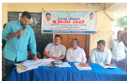
సభలో మాట్లాడుతున్న ప్రత్యేకాధికారి