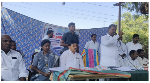
గ్రామసభలో మాట్లాడుతున్న ఎమ్మెల్యే గండ్ల

అక్షర దర్బార్, శాయంపేట : భూమిలేని నిరుపేదలను గుర్తించాలని భూపాలపల్లి ఎమ్మెల్యే గండ్ల సత్యనారాయణ రావు అన్నారు. మంగళవారం మండలంలోని మాందారి పేట గ్రామంలో నిర్వహించిన గ్రామసభకు ఆయన ముఖ్యఅతిథిగా హాజరై మాట్లాడారు. రాష్ట్ర ప్రభుత్వం నాలుగు పథకాల అమలు కోసం ఈ నెల 16 నుంచి 20 వరకు దరఖాస్తులు స్వీకరించి 21 నుంచి 24 వరకు అన్ని గ్రామాల్లో గ్రామసభలను నిర్వహించి అర్హులను ఎంపిక చేయనున్నట్లు తెలిపారు. ఇందిరమ్మ అత్యయ భరోసా కింద భూమిలేని నిరుపేదలు జాబ్ కార్డు ఉన్నవారందరికీ నెలకు రూ.1000 చొప్పున సంవత్సరానికి రూ.12 వేలు అందజేస్తున్నట్లు తెలిపారు. అర్హులు ఎవరైనా పేరు రాకుంటే గ్రామసభలో దరఖాస్తు చేసుకోవాలన్నారు. కార్యక్రమంలో కాంగ్రెస్ మండల