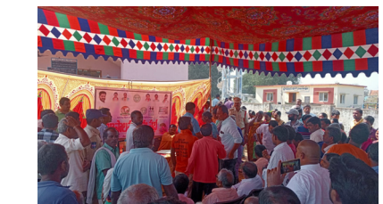
విలేజ్ కేసముద్రంలో అధికారులతో వాగ్వాదానికి దిగిన గ్రామస్థులు

అక్షర దర్బార్, కేసముద్రం : కేసముద్రం మండల వ్యాప్తంగా మంగళవారం నిర్వహించిన గ్రామసభలు రసాభాసాగా కొనసాగాయి. అనేక చోట్ల ప్రజలు అధికారులపై స్థానిక నాయకులపై తిరగబడ్డారు. పథకాలకు అనర్హులను ఎంపిక చేశారని మండిపడ్డారు. మండలంలోని విలేజ్ కేసముద్రంలో స్పెషల్ ఆఫీసర్, పంచాయతీ కార్యదర్శి నేతృత్వంలో నిర్వహించిన గ్రామ సభలో ప్రజలు అధికారులపై ప్రశ్నల వర్షం కురిపించారు. కొత్త రేషన్ కార్డులు, ఇందిరమ్మ ఇల్లు, రైతు భరోసా, ఇందిరమ్మ ఆర్థిక భరోసా పథకాలకు అనర్హులను ఎంపిక చేశారని ప్రజలు నిలదీశారు. దీంతో సభలో గందరగోళం నెలకొంది. అసలైన పేదలకు న్యాయం దక్కట్లేదన్నారు. కొత్త పెన్షన్లు ఎక్కడపో