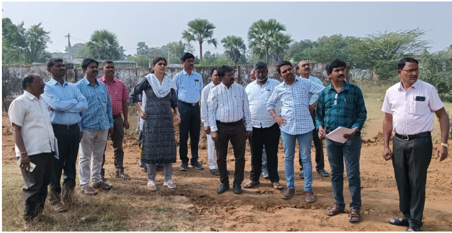
ప్రభుత్వ డిగ్రీ కళాశాల స్థలాన్ని పరిశీలిస్తున్న ఆర్డీవో ఉమారాణి, అధికారులు