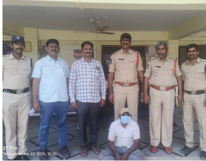
నిందితుడిని పట్టుకున్న పోలీసులు

చెందిన సన్నిధి ఆంజనేయులు కూలీ పనులు చేస్తూ వచ్చే ఆదాయంతో జల్పాలు చేసేవాడు. జల్పాలకు ఆదాయం సరిపోకపోవడంతో సులభంగా డబ్బు సంపాదించాలనుకున్నాడు. ఇందులో భాగంగా నిందితుడు సుబేదారి పోలీస్ స్టేషన్ పరిధిలోని చిల్లెన్స్ పార్క్ ప్రాంతంలో తాళం చేసి వున్న ఇంటిలో చోరీ చేసి ఐదు గ్రాముల బంగారు, 61 గ్రాముల వెండి ఆభరణాలు, రూ 60 వేల నగదును ఎత్తుకెళ్లాడు. నిందితుడు గతంలోనూ పలుమార్లు చోరీలకు పాల్పడటంతో పోలీసులు అరెస్ట్ చేసి జైలుకు తరలించారు. ఈ రోజు మరోమారు చోరీ చేసేందుకు హంటర్ రోడ్డు పరిసర ప్రాంతాల్లో అనుమానస్పదంగా తిరుగుతుండగా పోలీసులు అదుపులో తీసుకొని విచారించగా