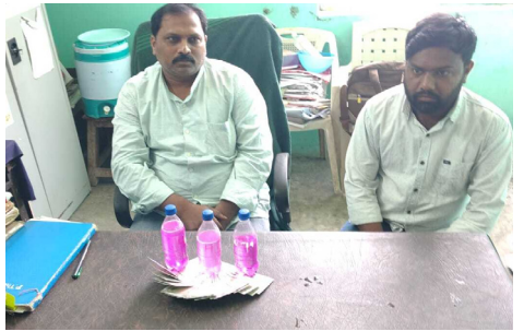
ఏసీబీ అధికారులకు పట్టుబడిన ఎస్టీవో

కోర్టు తీర్పుపై స్పందించారు వర్మ, "ఈ కేసు గురించి స్పష్టత ఇవ్వాలని అనుకుంటున్నా. ఇది 7 ఏళ్ల క్రితం జరిగిన విషయం. నా మాజీ ఉద్యోగికి సంబంధించిన రూ.2.38 లక్షల చెక్ బౌన్స్ కేసు. ప్రస్తుతం ఈ కేసు కోర్టులో ఉన్నందున దీనిపై ఇంతకు మించి ఏమీ చెప్పలేను" అని రామ్ గోపాల్ వర్మ అన్నారు.