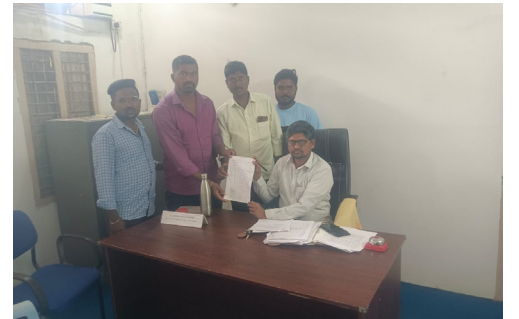
ఎంపీడివోకు వినతిపత్రం ఇస్తున్న గ్రామస్తులు

ములుగు జిల్లా వ్యాప్తంగా 2,800 ఎకరాలు సాగుకు యోగ్యంగా లేవని అధికారులు గుర్తించారు. అత్యధికంగా ములుగు మండలంలో 1, 334 ఎకరాలు, అతి తక్కువగా కన్నాయిగూడెం మండలంలో 53 ఎకరాలు గుర్తించారు. సర్వేకు ముందు ఇప్పటి వరకు రాష్ట్రప్రభుత్వం 83, 448 మంది రైతులకు మొత్తం 1,75,750 ఎకరాలకు రైతుబంధు పథకాన్ని వర్తింపజేసింది. మల్లంపల్లి మండలంలో దాదాపు 30 వరకు ఎర్రమట్టి క్యారీలుండగా, వీటి పరిధిలో వందల ఎకరాలు ఉన్నాయి. వీటిని కూడా సాగుకు పనికిరాని భూములుగా గుర్తించారు. సర్వే అనంతరం 1, 72, 950 ఎకరాలకు రైతు భరోసా అందనుంది.