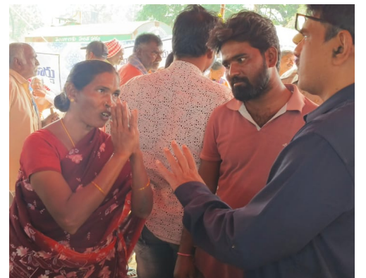
అధికారులను వేడుకుంటున్న నిరుపేద మహిళ