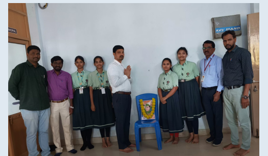
సుభాష్ చంద్రబోస్ చిత్రపటం వద్ద నివాళులర్పిస్తున్న ప్రిన్సిపాల్