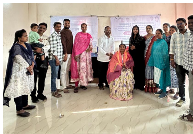
ఇందిరను సన్మానిస్తున్న తోటి ఉద్యోగులు