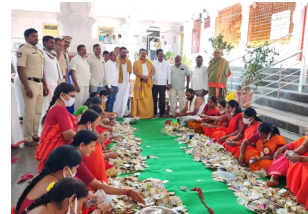
హుండీ ఆదాయాన్ని లెక్కిస్తున్న సిబ్బంది

అక్షర దర్బార్ భీమచేపరపల్లి : మండలంలోని భద్రకాళి నమేత వీరభద్ర స్వామి జాతర ఆదాయం రూ.1,10,36,563 నమోదైంది. దేవదాయ శాఖ ఇన్స్పెక్టర్ డి. అనిల్ కుమార్ పర్యవేక్షణలో మంగళవారం హుండీలను తెరచి లెక్కింపు ప్రారంభించారు. సంక్రాంతి బ్రహ్మోత్సవాలను పురస్కరించుకొని టెండర్లు ద్వారా 43,38,000,టిట్ల ద్వారా 30,71,341, హుండీ ఆదాయం 36,27,222, మిశ్రమ వెండి 1.90 గ్రాములు, మిశ్రమ బంగారం 8 గ్రాములు, 44 దాలర్లు వచ్చినట్లు ఆలయ ఈవో కిషన్ రావు వెల్లడించారు. గత సంవత్సరం గాను ఈ సంవత్సరం 16 లక్షలు అదనంగా ఆదాయం సమకూరినట్లు తెలిపారు. ఈ