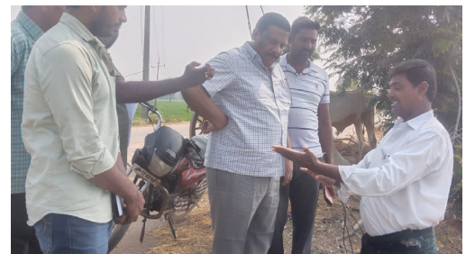
రైతులతో మాట్లాడుతున్న అదనపు కలెక్టర్