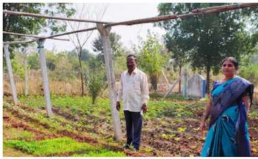
నర్సరీని పరిశీలిస్తున్న ఎంపీడిఓ