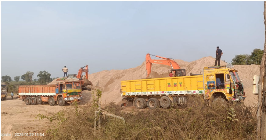
ipalle - 2025.01.29 15:54