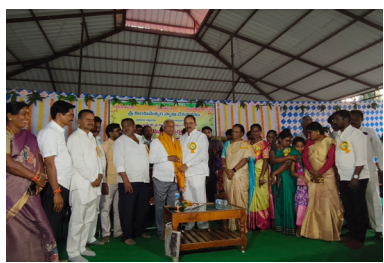
ఆలయ కమిటీని సన్మానిస్తున్న ఎమ్మెల్యే