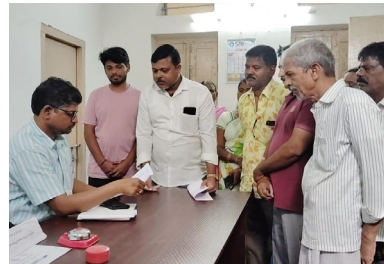
ఎంపీడీవోకు వినతిపత్రం ఇస్తున్న బాధితులు