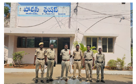
గుడుంబాను స్వాధీనం చేసుకుంటున్న పోలీసులు