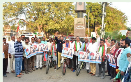
సైకిల్ విరామ సభలో మాట్లాడుతున్న బీసీ నేతలు