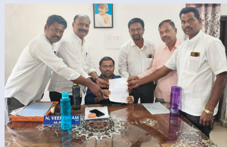
ఎంపీటీసీకు వినతిపత్రం ఇస్తున్న నాయకులు