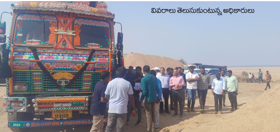
వివరాలు తెలుసుకుంటున్న అధికారులు