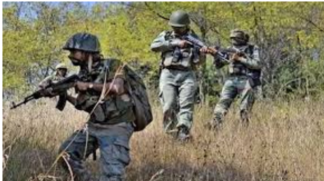
తూర్పు. కేంద్ర కమిటీ సభ్యుడు, ఏఓబీ సెషన్ల జోనల్ కమిటీ కార్యదర్శి చలపతితో పాటు 16 మంది వరకు మావోలు ఎన్ కౌంటర్ లో హతమయ్యారు. తాజాగా జరిగిన ఎన్ కౌంటర్ లో మరో ఎనిమిది ప్రాణాలు కోల్పోయారు.

అక్షర దర్బార్, ఛత్తీస్ గఢ్ : ఛత్తీస్ గఢ్ లో మరో భారీ ఎన్ కౌంటర్ జరిగింది. బీజాపూర్ జిల్లా గంగులూర్ అటవీ ప్రాంతంలో మావోయిస్టులు, భద్రతా బలగాలకు మధ్య ఎదురుకాల్పులు జరిగాయి. ఈ ఎన్ కౌంటర్ లో ఇప్పటి వరకు ఎనిమిది మంది మావోయిస్టులు మృతి చెందినట్లు సమాచారం. మృతుల్లో కీలక నేతలు ఉన్నట్లు, మృతుల సంఖ్య ఇంకా పెరిగే అవకాశాలున్నట్లు తెలుస్తోంది. మావోయిస్టుల గురించి పక్కా సమాచారం అందుకున్న భద్రతా బలగాలు గంగులూర్ అటవీ ప్రాంతంలో కూంబింగ్ చేపట్టారు. ఉదయం 8.30 గంటల ప్రాంతంలో పోలీసులు, నక్కల్స్ కు మధ్య ఎన్ కౌంటర్ ప్రారంభమైంది. ప్రస్తుతం ఇంకా మావోయిస్టులు, భద్రతా బలగాల మధ్య కాల్పులు జరుగుతున్నట్లు సమాచారం. ఇందుకు సంబంధించి మరింత సమాచారం తెలియాల్సి ఉన్నది. ఇటీవల కాలంలో మావోయిస్టులకు భారీ ఎదురుదెబ్బలు తగులు