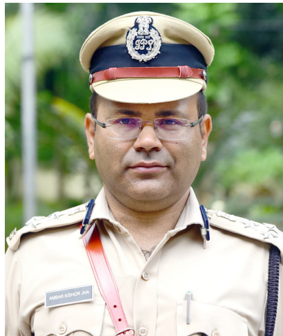
ఉన్నట్లు గుర్తించామన్నారు. ఈ తనిఖీల్లో చిన్నారులతో పనులు చేయించుకుంటున్న ఏడుగురు యజమానులపై కేసు నమోదు చేశామన్నారు. చిన్నారులతో వెట్టిచాకిరీ చేయించుకునే యాజమానులపై కఠిన చర్యలు తీసుకుంటామని హెచ్చరించారు. చిన్నారులను పనిలో పెట్టుకుంటే రెండు సంవత్సరాల జైలు శిక్ష, రూ. 50 వేల జరిమానా విధిస్తామని సీపీ హెచ్చరించారు.