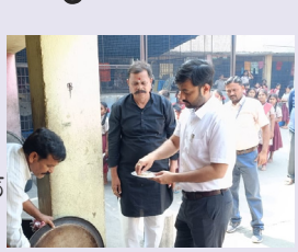
భోజనాన్ని పరిశీలిస్తున్న కలెక్టర్