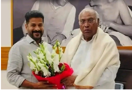
ఖర్చేకు పుష్కగుచ్ఛం అందిస్తున్న సీఎం రేవంత్ రెడ్డి

అక్షర దర్బార్, న్యూఢిల్లీ: మంత్రి పదవులపై ఆశపెట్టు కున్న ఎమ్మెల్యేలకు సీఎం రేవంత్ రెడ్డి షాక్ ఇచ్చారు. రాష్ట్రంలో కాంగ్రెస్ పార్టీ అధికారంలోకి వచ్చి ఏడాది దాటింది. పదేళ్ల తర్వాత పవర్ లోకి రావడంతో కాంగ్రెస్ ఎమ్మెల్యేలు మంత్రి పదవులపై ఆశలు పెట్టుకున్నారు. రేపో మాపో మంత్రివర్గాన్ని విస్తరిస్తారని ఆశగా ఎదురు చూస్తున్నారు. ఈ క్రమంలోనే ముఖ్యమంత్రి రేవంత్ రెడ్డి ఎమ్మెల్యేల ఆశలపై నీళ్లు చల్లారు. ఇప్పటికే మంత్రివర్గ విస్తరణ లేనట్లేనని సీఎం రేవంత్ రెడ్డి తెల్పి చెప్పారు. అంతేకాక మంత్రివర్గంలో ఎవరెవరు ఉండాలి అధిష్టానానిదే నిర్ణయం అని స్పష్టం చేశారు. మంత్రివర్గ విస్తరణ కోసం తాను ఎవరి పేర్లు ప్రతిపాదించడం లేదని కుండబద్దలు కొట్టారు. ప్రభుత్వం, పార్టీ నిర్ణయాలు అధిష్టానం దృష్టిలో ఉంటాయని, వ్యక్తిగత నిర్ణయాలు తీసుకోవడం ఉండదని సీఎం స్పష్టం చేశారు.