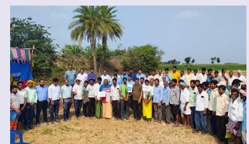
క్షేత్ర ప్రదర్శనలో పాల్గొన్న రైతులు, కంపెనీ ప్రతినిధులు