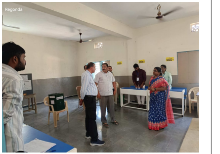
పోలింగ్ కేంద్రాన్ని సందర్శించిన అదనపు కలెక్టర్

ఎన్నికల పోలింగ్ లో భాగంగా గురువారం రేగొండ జెడ్పీహెచ్ఎస్ పోలింగ్ కేంద్రాన్ని అదనపు కలెక్టర్