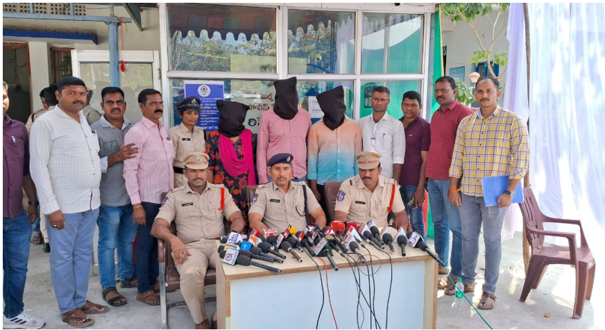
మీడియాకు వివరాలు వెల్లడిస్తున్న ఏసీపీ నందిరాం నాయక్