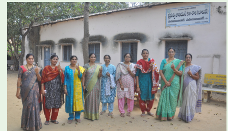
ఎమ్మెల్యే ఓ.టు బినయోగించుకున్న మహిళా ఉపాధ్యాయులు - అక్షర దర్బార్, మహబూబాబాద్

అక్షర దర్బార్, దుగ్గంపేట: మండలంలో పులి సంచారం కలకలం లేపుతోంది. వివరాలలోకి వెళ్తే మండలంలోని తొగరు రామయ్య పల్లె గ్రామంలో ఓ రైతు చేసుకున్న పులి పాదముద్రలు ఉన్నట్లు తెలియడంతో అటవీ శాఖ అధికారులకు సమాచారం అందించారు. దీంతో సంఘటన స్థలానికి చేరుకున్న అటవీశాఖ సెక్షన్ ఆఫీసర్ సోమ, దుగ్గంపేట ఎస్సెస్ డివిజన్ వెంకటేశ్వర్లు సిబ్బందితో కలిసి వచ్చి పాదముద్రలను పరిశీలించారు. అయితే పులి పాదముద్రలు చాలా పెద్దగా ఉంటాయని గోర్ర గుర్తులు పడవని ఇక్కడ గోర్ర గుర్తులు ఉన్నందున అవి పులి అడుగులు కావని హైనా లేదా కోన్ రీస్ అడుగులు అయి ఉండవచ్చని అన్నదాతలు ఎవరు అందోకన చెందాల్సిన అవసరం లేదని ఆయన తెలిపారు..