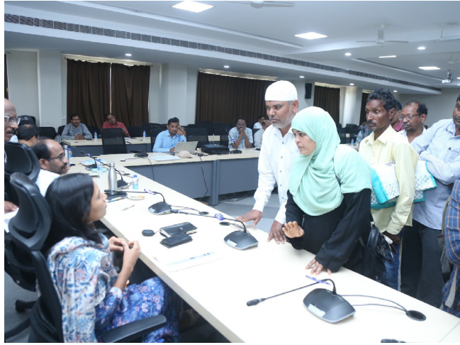
ప్రజల నుంచి దరఖాస్తులను స్వీకరిస్తున్న కలెక్టర్ ప్రావీణ్య

అక్షరదర్బార్, హనుమకొండ: వివిధ సమస్యలపై ప్రజావాణి కార్యక్రమంలో ప్రజల నుండి వచ్చిన అర్బలను సంబంధితశాఖల అధికారులు త్వరగా పరిష్కరించాలని హనుమకొండ జిల్లా కలెక్టర్ పి. ప్రావీణ్య ఆదేశించారు. సోమవారం హనుమకొండ జిల్లా కలెక్టరేట్లోని కాన్ఫరెన్స్ హాలులో ప్రజావాణి కార్యక్రమాన్ని అధికారులతో కలిసి కలెక్టర్ నిర్వహించారు. ప్రజల నుండి వచ్చిన అర్బలను కలెక్టర్ ప్రావీణ్య, అదనపు కలెక్టర్ వెంకట్ రెడ్డి, ఇతర ఉన్నతాధికారులు స్వీకరించారు. జిల్లాలోని పలు మండలాలకు చెందిన ప్రజలు వివిధ సమస్యలను పరిష్కరించాలని కోరుతూ ప్రజావాణి కార్యక్రమంలో 76 అర్బలను అందజేశారు. ఈ సందర్భంగా జిల్లా కలెక్టర్ ప్రావీణ్య మాట్లాడుతూ.. ప్రజావాణి కార్యక్రమంలో ప్రజల నుండి అందిన వివిధ సమస్యలను పెండింగ్లో లేకుండా త్వరగా పరిష్కరించేందుకు చర్యలు చేపట్టాలన్నారు. కార్యక్రమంలో