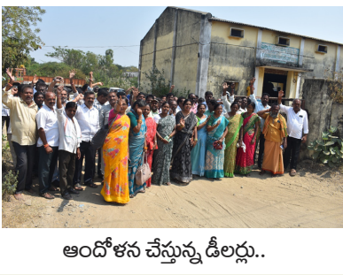
ఆందోళన చేస్తున్న డీలర్లు..