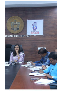
కాన్ఫరెన్స్ లో హన్మకొండ కలెక్టర్