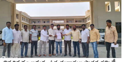
వినతిపత్రం ఇస్తున్న ఉద్యమకారుల సాధన కమిటీ