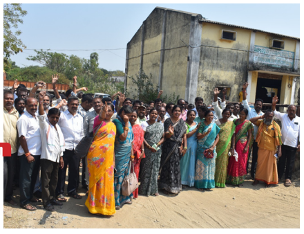
ధర్నా చేస్తున్న రేషన్ డీలర్లు

అక్షర దర్బార్, పరకాల : పరకాల ఎంఎల్ఎస్ ఫైట్ దగ్గర మోసాలు జరుగుతున్నాయని అక్షర దర్బార్ పత్రిక ముందే తెలిపిన విషయం పాఠకులకు విధితమే. అక్షర దర్బార్ కథనానికి పరకాల, శాయంపేట, నడికూడ, అత్మకూరు, కమలాపూర్ మండలాల అధ్యక్షులు, కార్యదర్శులు, డీలర్లు సోమవారం పరకాల ఎంఎల్ఎస్ పాయింట్ వద్ద ధర్నాకు దిగారు. ఈ ధర్నాలో డీలర్లు మాట్లాడుతూ ప్రతి బస్తా గోడంలో తూకం వేసి తమకు పంపించాలని ఎన్నిసార్లు మొరపెట్టుకున్నా ఎం ఎల్ ఎస్ పాయింట్ ఇంచార్జ్ పెడచెవిని పెడుతున్నారని పేర్కొన్నారు. ఆయన గోడానో బస్తానీ తూకం వేస్తే 52