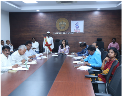
వీడియో కాన్ఫరెన్స్ లో పాల్గొన్న కలెక్టర్, అధికారులు