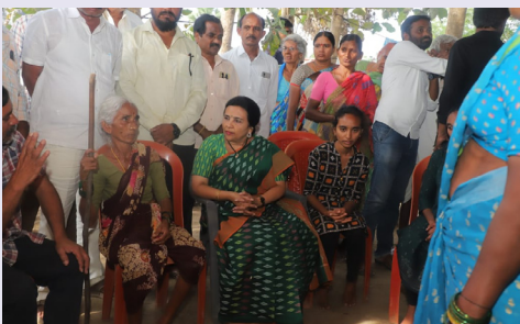
బాధిత కుటుంబ సభ్యులను పరామర్శిస్తున్న రూస్కెర్ డెవలప్మెంట్