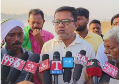
కారంలోకి వచ్చి 15నెలలు గడుస్తున్నా ఒక్క పని చేయ లేదని, 15నెలల కాలాన్ని వృథా చేశారని ఆరోపించారు.

మానేరుపై నిర్మించిన చెక్ డ్యూమేను సందర్శించారు. ఈ సందర్భంగా ఆయన మీడియాతో మాట్లాడుతూ.. నాడు అప్పటి ముఖ్యమంత్రి కేసీఆర్ గొప్పగా ఆలోచన చేసి అడవిసోమన్పల్లి గ్రామంలోని మానేరుపై చెక్ డ్యూమే నిర్మాణానికి శ్రీకారం చుట్టామని, ఈ చెక్ డ్యూమేతో అనేక ప్రయోజనాలు ఉంటాయని ఆలోచనతో నిర్మిస్తే దానిపై కాంగ్రెస్ నాయకులు రాధాంతం చేశారన్నారు. మానేరుపై నిర్మించిన చెక్ డ్యూమేతో నేడు భూగర్భజలాలు పెరిగాయని, మత్స్య సంపదతో అనేక కుటుంబాలు ఉపాధి పొందుతున్నాయన్నారు. మంథని ఎమ్మెల్యే అధి