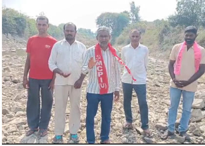
మాట్లాడుతున్న ఎంసీపీఐయూ నాయకులు