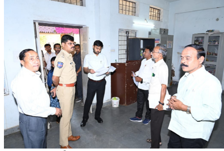
పరిక్షా కేంద్రాలను పరిశీలిస్తున్న కలెక్టర్