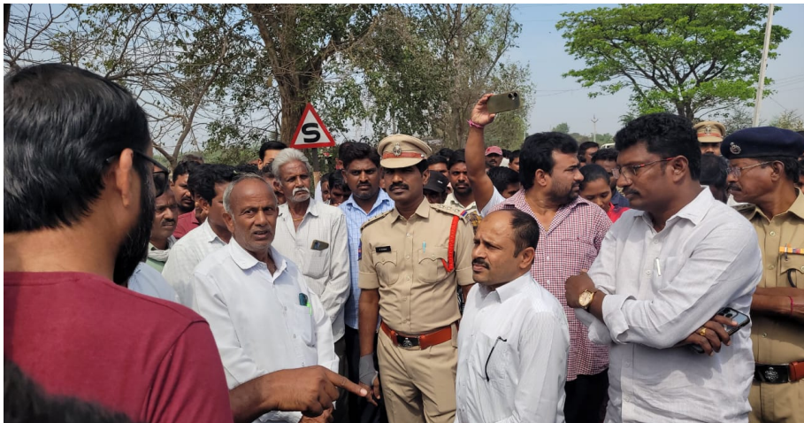
సర్వేకు వెళ్లిన అధికారులను అడ్డుకున్న రైతులు