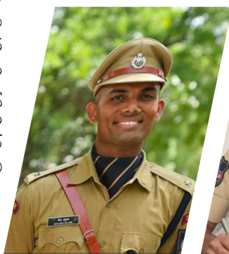
కరీంనగర్ సీపీ గౌస్ అలం