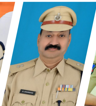
వరంగల్ క్రైమ్ డీసీపీ బి.జనార్దన్