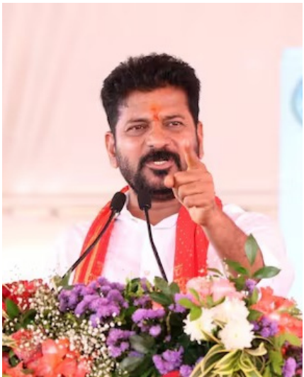
అని ముఖ్యమంత్రి అన్నారు. ప్రతిపక్షం లేని రాజకీయాలు చేయాలని తాము అనుకోవడం లేదన్నారు. వాళ్ళు మూసీని ధర్మా చౌక్ మేం తెరిచామన్నారు. విమర్శలు చేస్తే పరిశీలించుకుంటామని.. సలహాలు ఇస్తే తప్పకుండా స్వీకరిస్తామని వెల్లడించారు. ఎన్ఎల్బీసీ టన్నెల్ వీలైనంత త్వరగా పూర్తి చేస్తామన్నారు.

లక్ష్మణ్ అని ఆరోపించారు. ప్రాజెక్టులు ముందుకు వెళ్ళకుండా అడ్డుకుంటుంది రాష్ట్ర బీజేపీ నేతలే అని మండిపడ్డారు. మూసీకి నిధులు తెస్తే కిషన్ రెడ్డికి సన్మానం చేసి గండపిందేరం తొడుగుతానన్నారు. సబర్బన్, యమునా, గంగా ప్రక్షాళనకు నిధులు ఇస్తున్న కేంద్రం మూసీకి ఎందుకు ఇవ్వడం లేదని ప్రశ్నించారు. కేసీఆర్ కు బలువు... "నేను రాష్ట్ర ముఖ్యమంత్రిని. కేసీఆర్ ను ఓడించింది నేను. కేసీఆర్ ను గుండుసున్నా చేసింది నేను. కేసీఆర్ ను బండకేసి కొట్టింది నేను. అడ్డగోలుగా మాట్లాడడంలో కేసీఆర్ కు మించినవాళ్ళు ఎవరున్నారు. కేసీఆర్ స్థాయి ఏంటి. కేసీఆర్ కు బలువు తప్ప ఏముంది. తండ్రి కొడుకులకు బలువు తప్ప ఏముంది. అసెంబ్లీలో అధికార పక్షం కంటే ప్రతిపక్షానికి ఎక్కువ సమయం ఇస్తున్నాం"