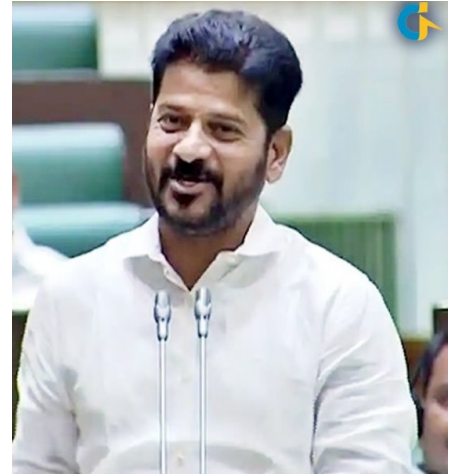
బాలను బజారుకీడుస్తోందని మండిపడ్డారు.

సోషల్ మీడియాలో తన ఫోటోలు మార్పింగ్ చేసి మానసిక క్షోభకు గురి చేశారంటూ మంత్రి సీతక్క ఆవేదన వ్యక్తం చేశారు. అన్నాచెల్లెళ్ల అనుబంధాన్ని కొంతమంది దుర్మార్గులు తప్పుగా చిత్రీకరిస్తున్నారని మండిపడ్డారు. సోషల్ మీడియా పల్ల తాను కుమిలిపోయానని, దాన్ని కట్టడించడం చాలా అవసరమని అన్నారు. సోషల్ మీడియాలో వ్యక్తిత్వ హననం చేస్తున్నారని, దాంతో తాను డీ మోరల్ అయినట్లు సీతక్క వెల్లడించారు. సోషల్ మీడియాను బీఆర్ఎస్ అబద్ధాల ప్రచారానికి వాడుతోందని, అది కుటుం