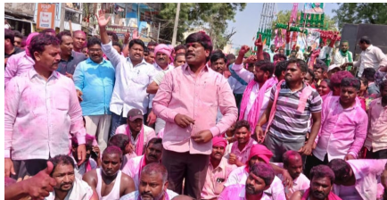
గిర్మి బావి సెంటర్లో పోలీసుల వైఖరికి రాస్తారోకో చేస్తున్న మాజీ ఎమ్మెల్యే పెద్ది