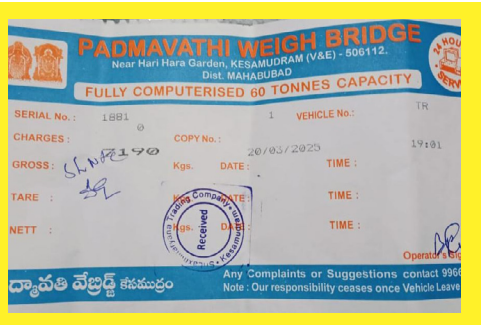
ఓకే సరుకుకు రెండు వేబ్రిడ్జిల వద్ద వేర్వేరుగా వచ్చిన తూకం జల్లులు