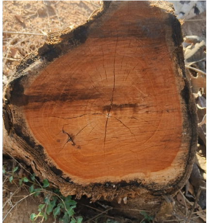
వర్షన్నపేట వద్ద అక్రమంగా కట్ చేసిన ఓ టేకు చెట్టు మొద్దు

అక్షరదర్బార్, వరంగల్ : అటవీశాఖలోని కొందరు అధికారులు తమ కర్తవ్యాన్ని పక్కన పెడుతున్నారు. స్వప్రయోజనాల కోసం అక్రమార్కులను ప్రోత్సహిస్తూ అందిన కాడికి దండుకుంటున్నారు. తద్వారా ప్రభుత్వ ఆదాయానికి గండి కొడుతున్నారు. వరంగల్ జిల్లా వర్షన్నపేట మున్సిపాలిటీ పరిధిలో జరిగిన ఓ ఘటన ఇందుకో మచ్చుతునక. ఇక్కడ ఓ ప్రైవేటు వ్యక్తికి చెందిన పట్టా భూమిలోని సుమారు రూ.కోటికిపైగా విలువైన టేకు