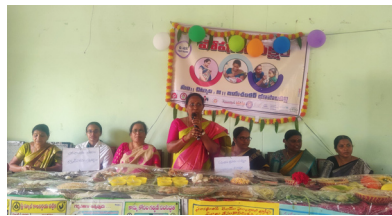
అంగన్వాడీ సెంటర్ల సేవలను సద్వినియోగం చేసుకోవాలన్నారు. మహిళలు గర్భం ధరించినపుటి