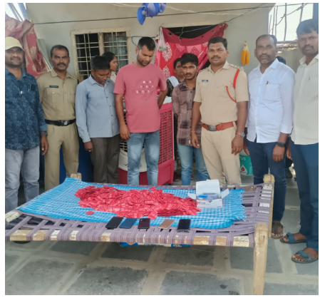
కొనసాగిస్తున్నది. ఆమెతో పాటు బానోజీపేట గ్రామానికి