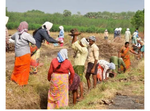
కూలీలు ఇంటి వద్ద నుండే బాటిల్స్ తెచ్చుకుని తాగుతున్నారు. ...

గ్రామీణ ఉపాధి హామీ పథకాన్ని అప్పటి కేంద్ర ప్రభుత్వం ప్రవేశపెట్టింది. కూలీలకు ఉపాధి కల్పించేందుకు అప్పటి సర్కారు సంవత్సరంలో 100 రోజులు పనులు కల్పిస్తున్నారు. కూలీల వేతనాలు కూడా పెంచారు. కానీ పనుల వద్ద మాత్రం సౌకర్యాలు కల్పించకపోవడంతో ఉపాధి కూలీలు పడుతున్న ఇబ్బందులు అంతాఇంతా కాదు. పనుల వద్ద తగిన సౌకర్యాలు కల్పించకపోవడంతో అధికారులు విమర్శల పాలవుతున్నారు. మౌలిక వసతులు లేక ప్రత్యామ్నాయ మార్గాలను వెతుక్కుంటున్నారు. కనీసం పనుల వద్ద ఓఆర్ఎస్ ప్యాకెట్లు అందుబాటులో ఉంచడం లేదు మెడికల్ కిట్లు సైతం అందజేయడం లేదని కూలీలు అంటున్నారు. ఎండలకు పనిచేస్తున్న నేపథ్యంలో వడదెబ్బ తగలకుండా ఉండేందుకు ఓఆర్ఎస్ ప్యాకెట్లను అధికారులు అందుబాటులో ఉంచాలి. మంచి నీళ్లు కూడా